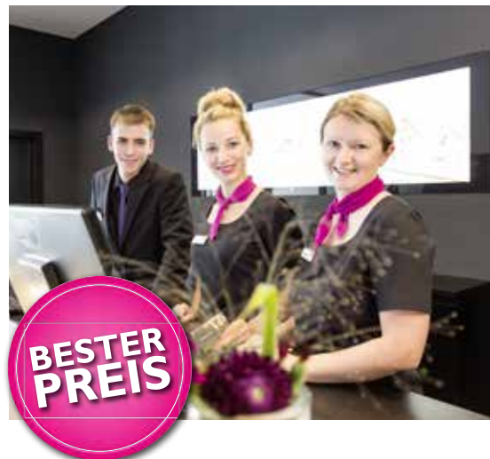
Preischecker 47° Website

mohren-bodensee.de 47grad.de | hotel-k99.de hotel-trezor.de